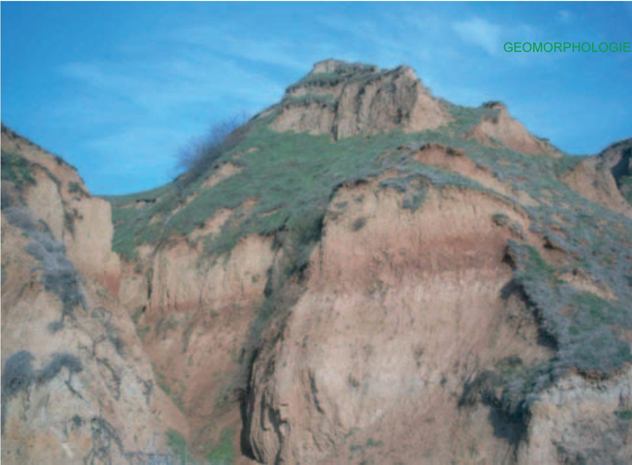
Erosion im südlichen Olt-Tal, Rumänien (U.Hambach). Zwischen hellen Löss-Schichten, die auf trockenes Klima hinweisen, liegen dunklere Paläoböden. Die dunklen Böden sind charakteristisch für Phasen, in denen Niederschlag stärkeren Pflanzenbewuchs ermöglichte.

eines zeitlichen Gradienten Zusammenhänge zwischen Ablagerungen und Klimaänderungen beobachtet werden können. Bisher aber gibt es nur wenige Untersuchungen darüber, inwieweit diese Zusammenhänge entlang räumlicher Gradienten variieren. Dies ist für Prognosen von entscheidender Bedeutung. So ist das Paläoklima in West- und Mitteleuropa zwar ausführlich beschrieben, für Osteuropa aber gibt es kaum Daten. Im März