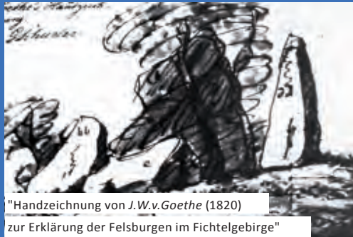
"Handzeichnung von J.W.v.Goethe (1820) zur Erklärung der Felsburgen im Fichtelgebirge"