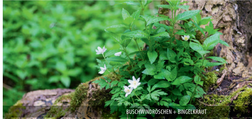
BUSCHWINDRÖSCHEN + BINGELKRAUT