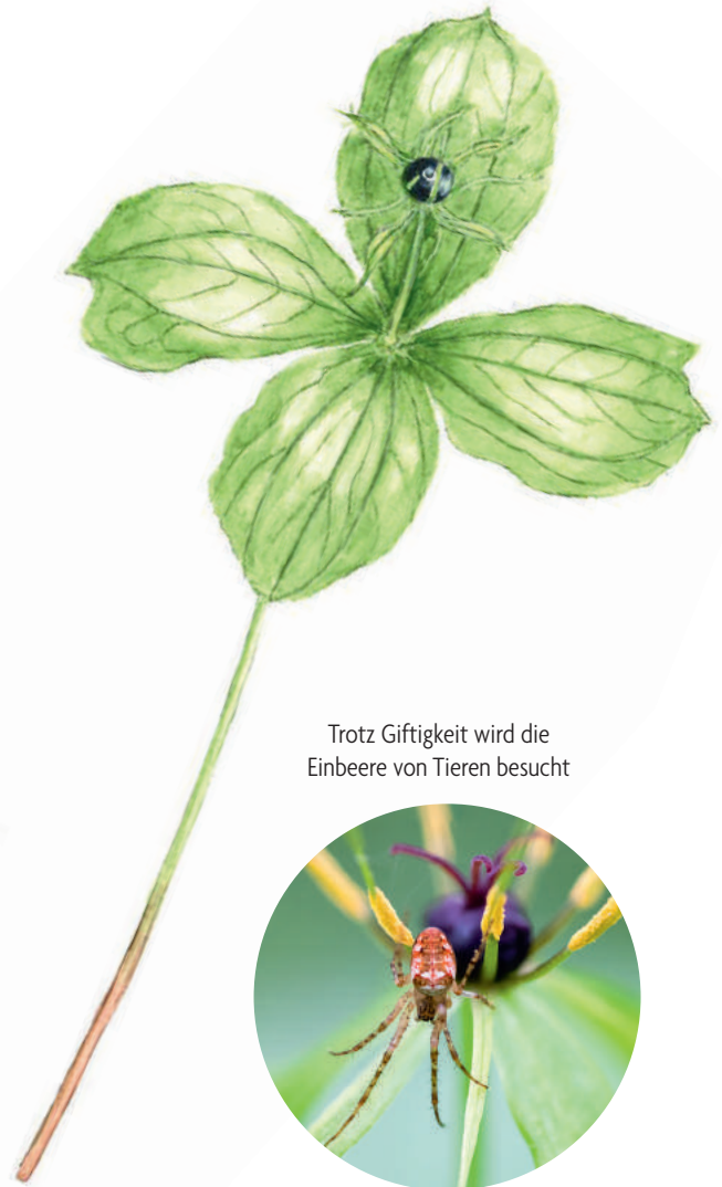
Trotz Giftigkeit wird die Einbeere von Tieren besucht

Der Einbeere wurden früher auch Zauberkräfte zugesprochen. Im 14. Jahrhundert wurde sie als „Pestbeere“ in Kleider eingenäht und am Körper getragen, in der Hoffnung, dass sie vor der Pest schützen möge. Außerdem gab es den Aberglauben, dass die Pflanze Menschen von Dämonen befreien könne.